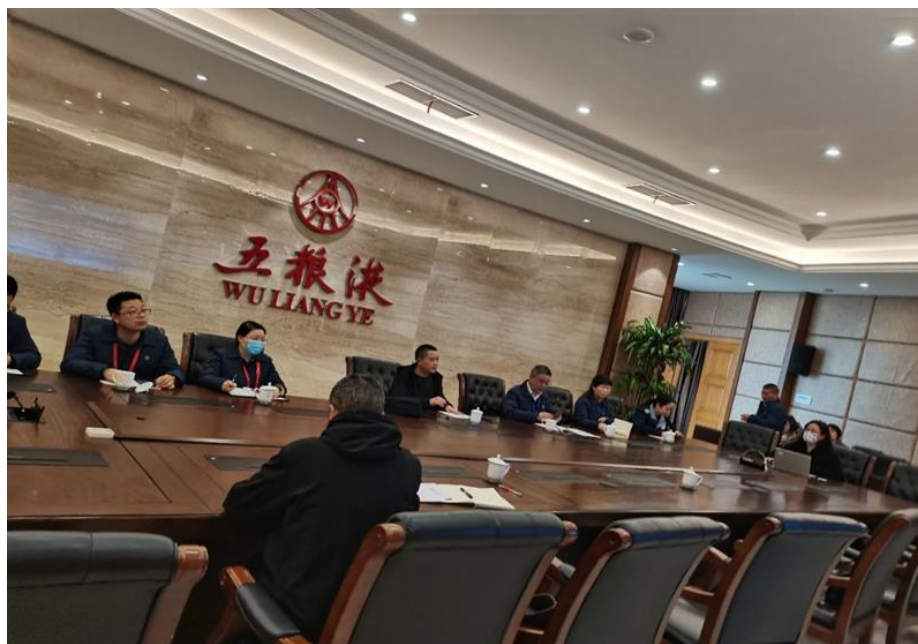
图 2 校企共研人才培养方案