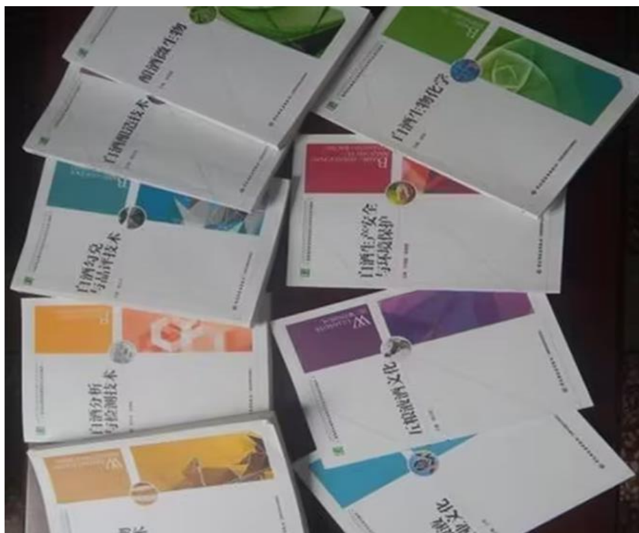
图 6 校企合作教材