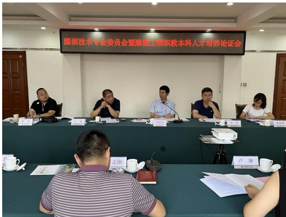
图 4 校企共建酿酒工程职教本科试点专业