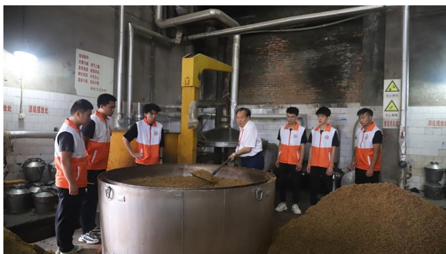
图9 学生在企业实习

公厅等五部门关于实施职业教育现场工程师专项培养计划的通知》(教职成厅[2022]2号)、《教育部办公厅关于开展第一批现场工程师专项培养计划项目申报工作的通知》(教职成厅函(2023)6号)精神,进一步满足五粮液“高质量倍增工程”对白酒技术技能人才提出新要求,在五粮液技术学院的基础上,校企双方各自发挥资源优势,在新经济业态下,实现校企紧密合作,整合教育教学资源,在共同发展基础上,共建“白酒智造现场工程师培养项目”,进一步优化人才供给结构,加快培养更多适应新技术、新业态、新模式的高素质技术技能人才、能工巧匠、大国工匠,适应现代企业发展和产业转型升级要求,创新企业所需技能人才培养模式,探索培养一批具备工匠精神,精操作、懂工艺、会管理、善协作、能创新的现场工程师,健全完善技能人才培养工作新机制,提高劳动者职业能力和职业素养,促进企业发展和地方经济发展方式转变。