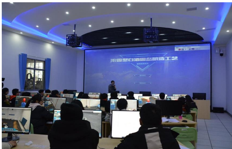
图 8 校企共建“匠心善酿”虚拟仿真实训基地