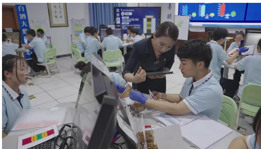
图 5 校企共建白酒大数据中心资源在课堂应用

1 个。二是数字赋能、虚实结合，教学改革成效突出，积极利用数字场景改革传统工艺技术，结合虚拟仿真技术突破教学重点和难点，“高职酿酒专业‘虚实识岗、虚实习岗、真实顶岗’实践教学改革创新”获四川省职业教育教学成果奖二等奖，“创新酒都工坊，培育酒都工匠”立项为省级职业教育教学改革重大项目，“数字化赋能酿酒技术专业群建设的创新实践”等 2 项课题成功立项省级重点项目。岗课赛证创融合，教材建设取得重大突破，校企合作建成首套高职酿酒专业系列教材 18 部，其中《白酒酿造技术》《作物病虫害防治》入选国家职业教育“十四五”规划教材；《酿酒微生物》《白酒分析与检测》入选省级职业教育“十四五”规划教材；开发活页式工作手册式教材 10 种。